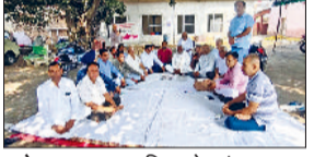
फतेहाबाद। नगरपरिषद के अंदर धरना देते पार्षद।

नगरपरिषद अधिकारियों की मनमानी और विकास कार्य ठप होने से परेशान नगर पार्षदों ने अब आंदोलन को तेज करने का निर्णय लिया है। नगरपरिषद के अंदर धरना दे रहे पार्षदों ने ऐलान किया है कि सोमवार से वे नगर परिषद की चारदीवारी के भीतर नहीं, बल्कि मुख्य गेट पर धरना देंगे। आंदोलन को और व्यापक बनाने