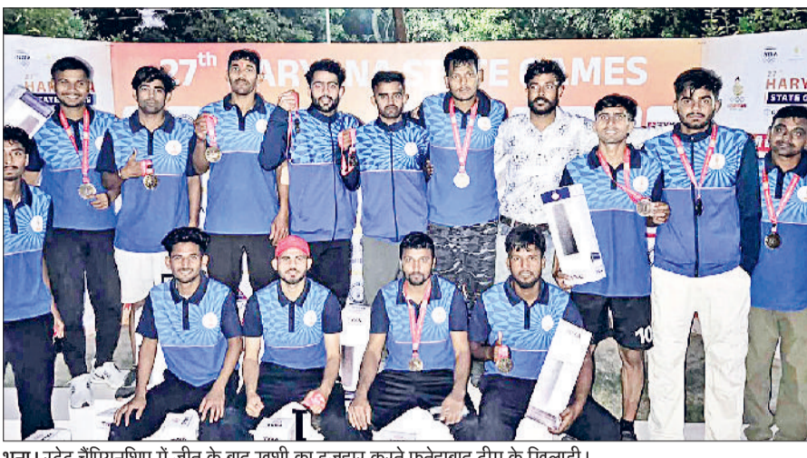
भूना। स्टेट चैम्पियनशिप में जीत के बाद खुशी का झज्जर करते फतेहाबाद टीम के खिलाड़ी।