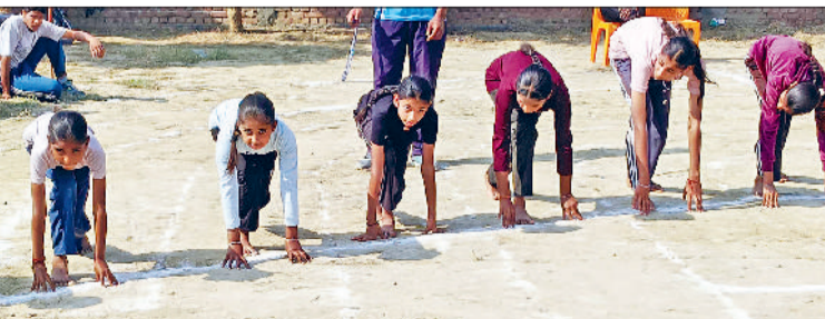
रतिया। डीएवी स्कूल नागपुर में आयोजित खेल प्रतियोगिता में भाग लेते विद्यार्थी।