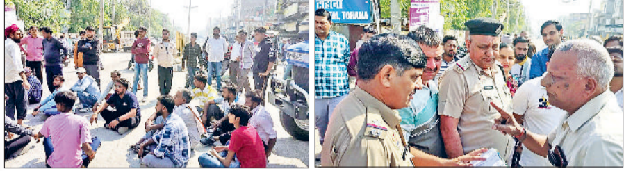
टोहाना। रोड जाम करते परिजन तथा प्रदर्शनकारियों से बातचीत करते पुलिस अधिकारी।