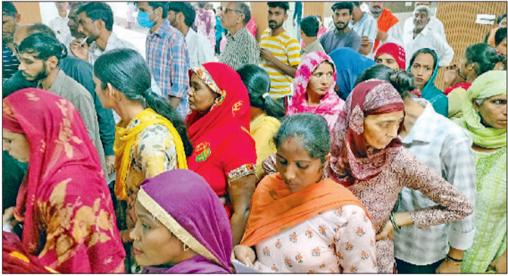
फतेहाबाद। नागरिक अस्पताल में उमड़ी मरीजों की भीड़।