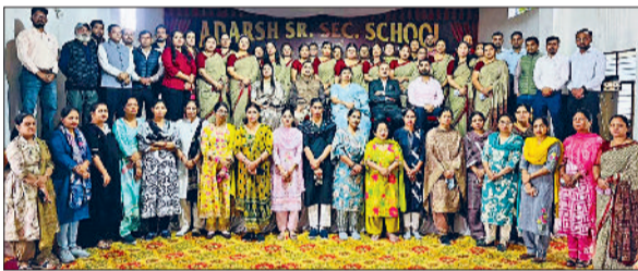
फतेहाबाद। आदर्श स्कूल दरियापुर में आयोजित प्रशिक्षण सत्र में भाग लेते शिक्षक।

स्कूल शिक्षकों के अलावा अन्य विद्यालयों के शिक्षकों ने भी इस सत्र में सक्रिय रूप से भाग लिया और छात्रों में लाइफ स्किलस को विकसित करने के तरीकों पर चर्चा