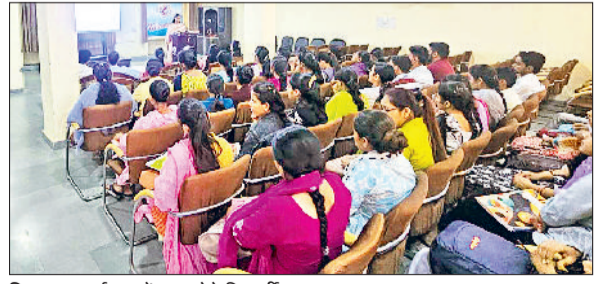
सिरसा। कार्यक्रम में भाग लेते विद्यार्थी।