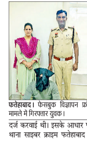
फतेहाबाद। फेसबुक विज्ञापन फ्रॉड मामले में गिरफ्तार युवक।